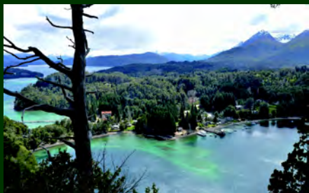
Vista desde mirador Bahía Mansa

- De la península: el Bosque de Arrayanes está conectado con Villa La Angostura a través de un sendero peatonal de 12 km. Desde Villa La Angostura, en un recorrido de mediana dificultad se transita por el bosque, lugares abiertos de vegetación y, casi al finalizar, se arriba a la laguna Patagua donde comienza a predominar el arrayán.